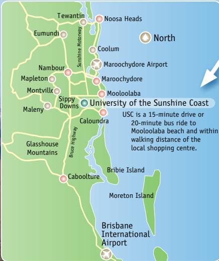
Map not to scale